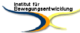
Seminare die bewegen e.U. Institut für Bewegungs- entwicklung

Das Leistungsdenken und die Lebensumstände unserer Gesellschaft verhindern zunehmend, dass Kinder eine kindgerechte Kindheit erleben dürfen. Diese in der Kindheit erworbenen Defizite (sowohl körperliche als auch psychische) bedeuten neben dem individuellen Leidensweg bereits jetzt, jedoch noch viel mehr in späterer Folge immense Kosten für Gesundheitssystem und Staat, deren Ausmaß in keinsten Weise absehbar ist.